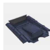
KDF Typ Beton