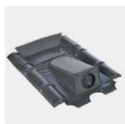
RDF Typ Beton mit Tülle