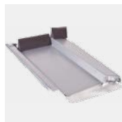
Typ Grande 360