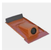
RDF Typ Ton mit Tülle