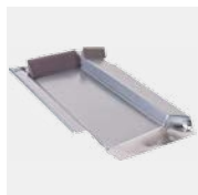
Typ Grande 336