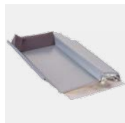
Typ Extra 325