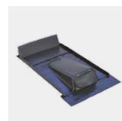
KDF Typ Ton