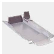
Typ Ton 255