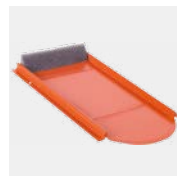
Typ Biber Vario