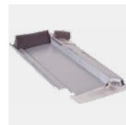
Typ Grande 280