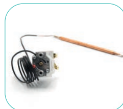
Réf. 710111 Limiteur de température plancher 65° C