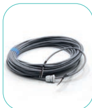
Réf. 753102 Câble blindé 50 m de liaison