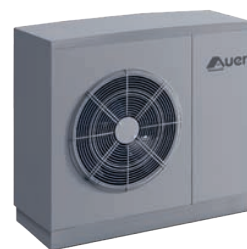
REB70 5, 7 et 11 kW HTi70 6, 8, 11 et 14 kW

Accessoires nécessaires (hors sonde sanitaire et sonde d'ambiance et/ou thermostat d'ambiance et limiteur de température plancher 65°C ; 1 limiteur est déjà intégré au Thorix Evolution.