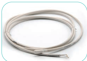
Réf. 751004 Cordon dégivrage externe