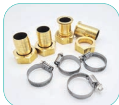
Réf. 754210 Raccords sapin DN 30