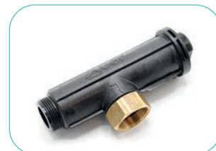
Réf. 711000 Kit de filtration grande capacité