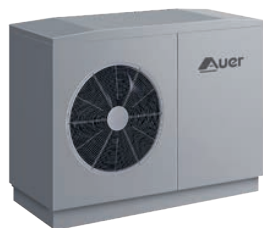
HTi70 6, 8, 11 et 14 kW